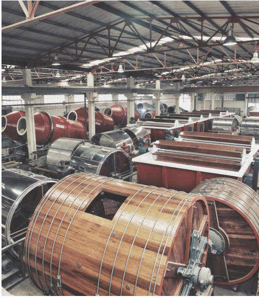
[2700 metre karelik imalat alanı]